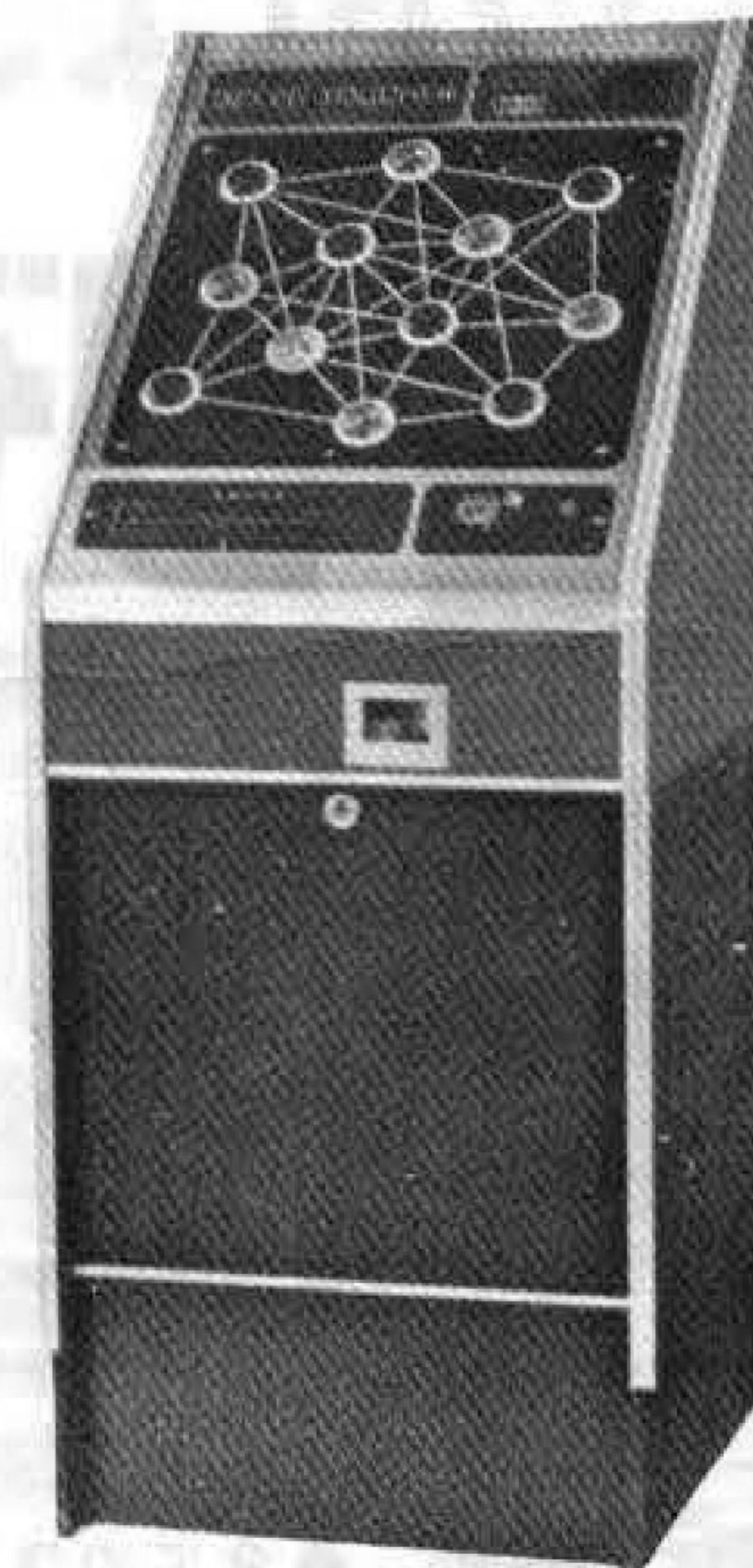
スピードタッチャー

ネクストゲームをプラスすべて豪華になりました。▽91-9794 ホッパー採用 JP250・300