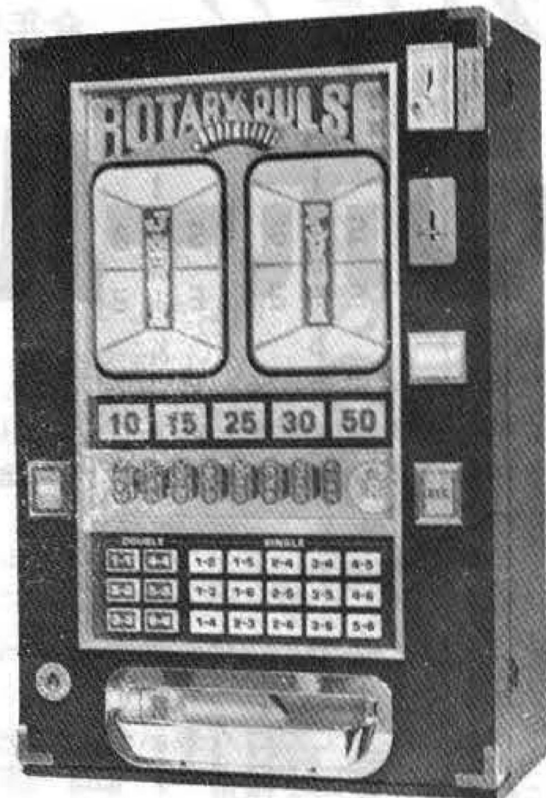
ロータリーパルスジュニア

ネクストゲームをプラスすべて豪華になりました。▽91-9794 ホッパー採用 JP250・300