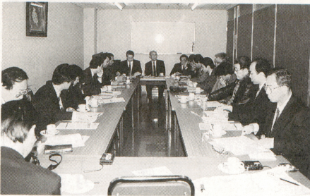
大阪府協会、第60回理事会の模様(2月6日)