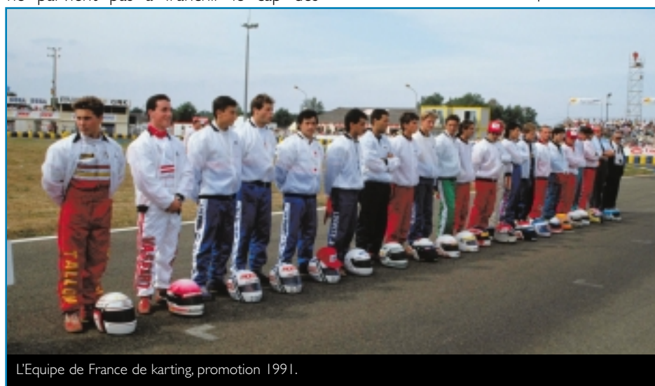
L'Equipe de France de karting, promotion 1991.